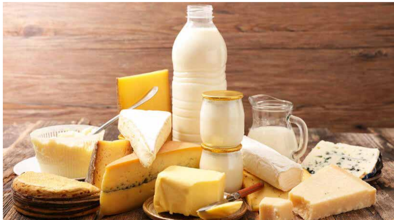
Le lait et ses dérivés contiennent des nutriments essentiels pour la santé humaine dont le calcium, les vitamines A, B et D.

Le nutritionniste Aloys Niyongabo précise que le lait permet un équilibre de nutriments du fait qu'il est naturellement riche en nutriments, et qu'il est équilibré par une proportion unique de glucides et de protéine, en plus du calcium, du phosphore et de la vitamine D. Il permet