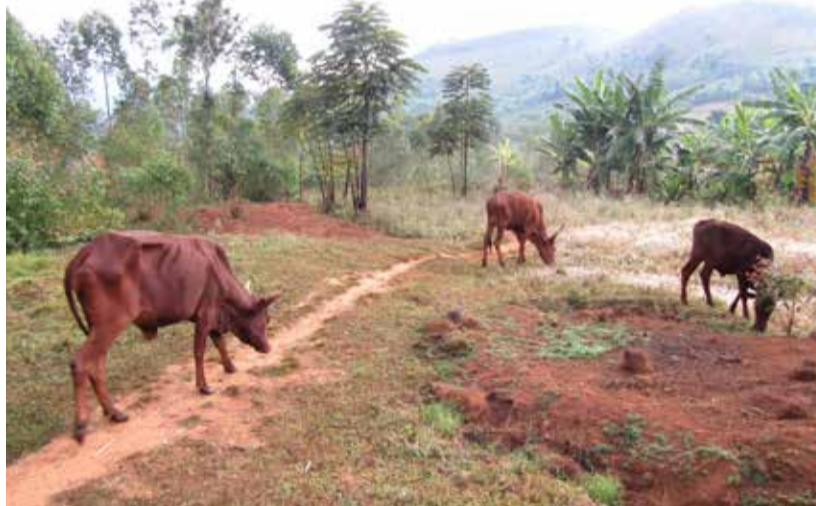
De peur d'être sanctionnés pour non application de la loi sur la stabulation permanente les éleveurs préfèrent réduire leurs troupeaux.

De peur d'être sanctionnés pour non application de la loi sur la stabulation permanente les éleveurs préfèrent réduire leurs troupeaux. Au marché de Rwibaga en commune de Mugongo-Manga, les prix des vaches explosent ces derniers jours. Une génisse coûte entre 1 000 000 et 1 300 000 FBu alors qu'un veau se négocie à 900 000 FBu. Pour Gaston Mpawenimana, boucher rencontré sur place, les prix restent élevés. Pour lui, le marché risque d'être stabilisé d'ici peu. En avril dernier, il y