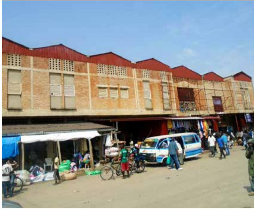
Même si les vendeurs ambulants sont un secret de Polichinelle, ils ne sont pas reconnus légalement au marché de Ruvumera.

Au marché de Ruvumera, ce n'est qu'à l'étage qu'est réservée la vente des vêtements de seconde main. Mais au rez-de-chaussée, les vendeurs ambulants foisonnent. Ce que les commerçants ne voient pas d'un bon œil