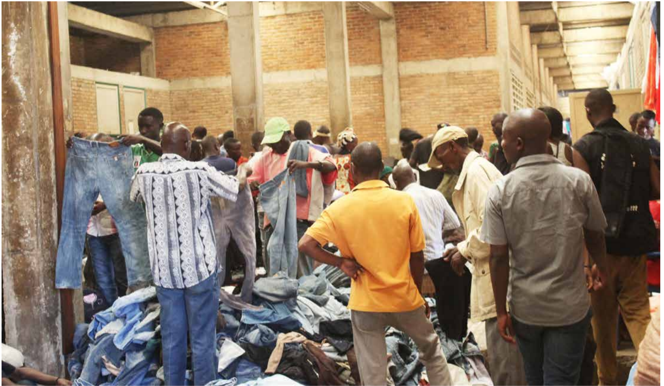
Après la réhabilitation du marché de Ruvumera en 2008, il était convenu que le commerce des vêtements se fasse exclusivement à l'étage. Mais dans ces dernières années, il y a beaucoup de vendeurs ambulants qui travaillent au rez-de-chaussée de ce marché.