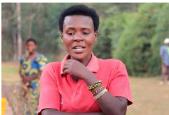
Projets de développement des Batwa de Bururi

Nouveau mot d'ordre pour les ambassadeurs burundais (page 3)