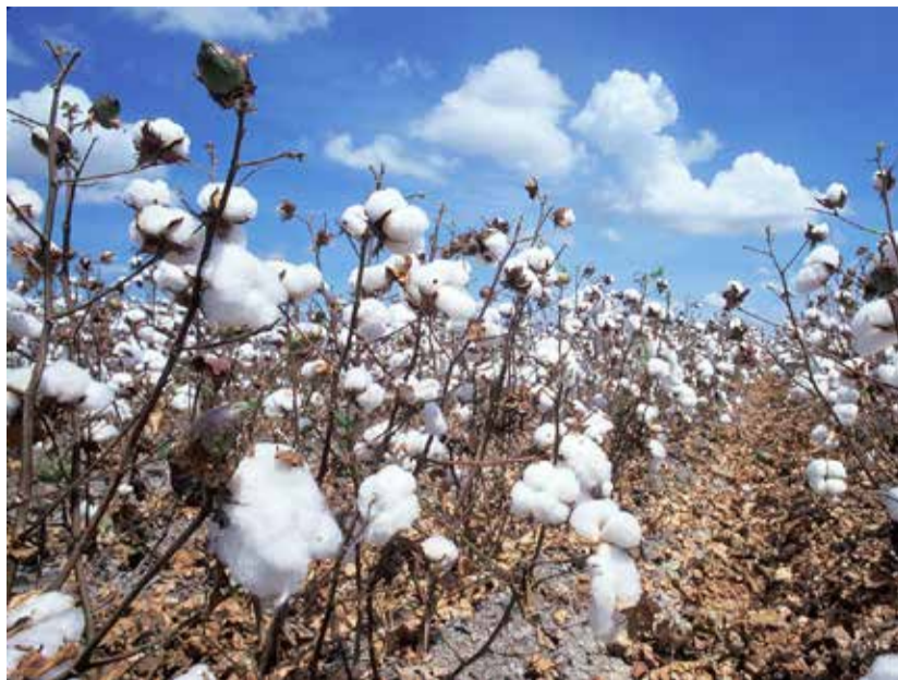
La filière cotonnière connaît pas mal d'embûches.

Au cours de la campagne 2020-2021, la Compagnie de Gérance du Coton «Cogenco» a produit 1010 tonnes d'or blanc. Malgré cette production, cette société est au bord du gouffre. Elle est très endettée et le niveau de sa dette est supérieur à la normale. Avec le processus de signature d'un contrat de partenariat public-privé entre l'Etat et l'Afritextile, on espère que cette société de production et de transformation du coton graine en coton fibre pourra se revivifier un jour