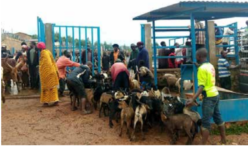
Le prix du bétail a commencé à augmenter depuis le mois de juillet 2021 au marché de Rwibaga.

La comptabilité communale de la commune Mugongo-Manga et les commerçants du bétail doutent de ce que leur réserve le marché de Rwibaga. Ils craignent une probable diminution des recettes et une augmentation du prix du bétail et, partant, du prix de la viande. Cela au moment où la mise en application de la loi sur la stabulation permanente est prévue au 4 octobre 2021