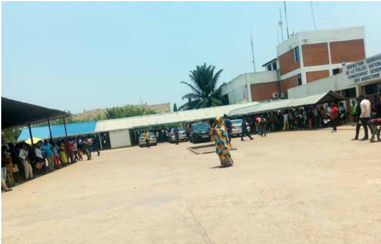
Les demandeurs de passeports biométriques sont obligés d'attendre pendant plusieurs mois pour en avoir.

Arrivé dans la cour de la PAFE, on se retrouve au milieu des centaines de gens à la recherche des documents de voyage. Les salles d'attente sont débordées. Les gens trainent devant les bureaux avec des papiers en main. Selon un jeune garçon qui attend sur la file, il n'est même pas facile de déposer son dossier. « J'ai dû attendre depuis 8 heures