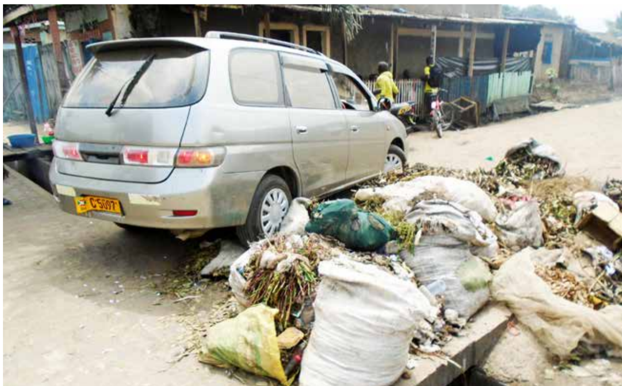
La population devrait changer de mentalités pour vivre dans une ville résiliente et propre.

Le comportement de jeter les bouteilles en plastique ou d'autres sortes de déchets dans la rue devrait être changé. Cela dans l'optique de protéger l'environnement. Sinon, des sanctions sont prévues. La commune de Mukaza prend le devant. Une amende de 10 mille FBu sera infligée aux auteurs de ce délit à partir du 1 er octobre 2021