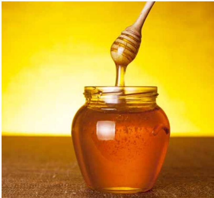
Le miel ne doit pas être conservé n'importe comment. Il y a des exigences à respecter à tout prix.

En ce qui est du conditionnement et de la conservation du miel, les emballages en plastique ou en verre peuvent être utilisés. Simple-ment, il faut que leur propreté soit assurée. Pourtant, le contenant le plus recommandé c'est le verre. Une bouteille ou un bidon en plastique devrait être utilisée pour une conservation de courte durée, par exemple dans le transport. Pareils récipients risquent de dénaturer le miel. Pourtant, tous les plastiques ne sont pas recommandés pour con-