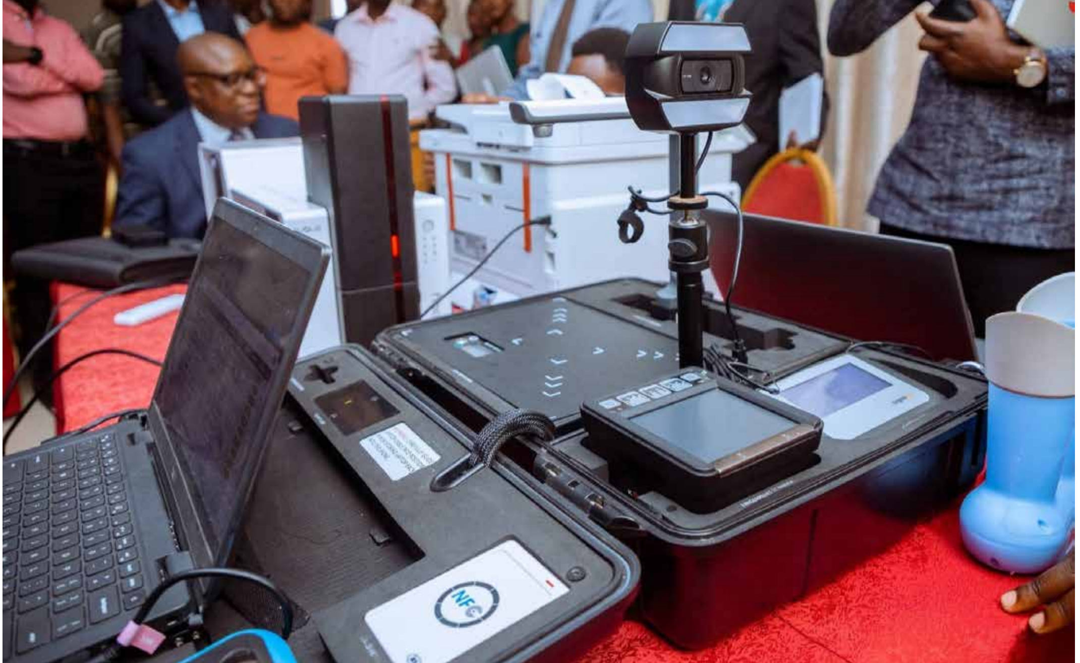
Une plateforme numérique dédiée à la gestion des documents d'état civil et à la production de la future carte nationale d'identité (CNI) biométrique est désormais opérationnelle.