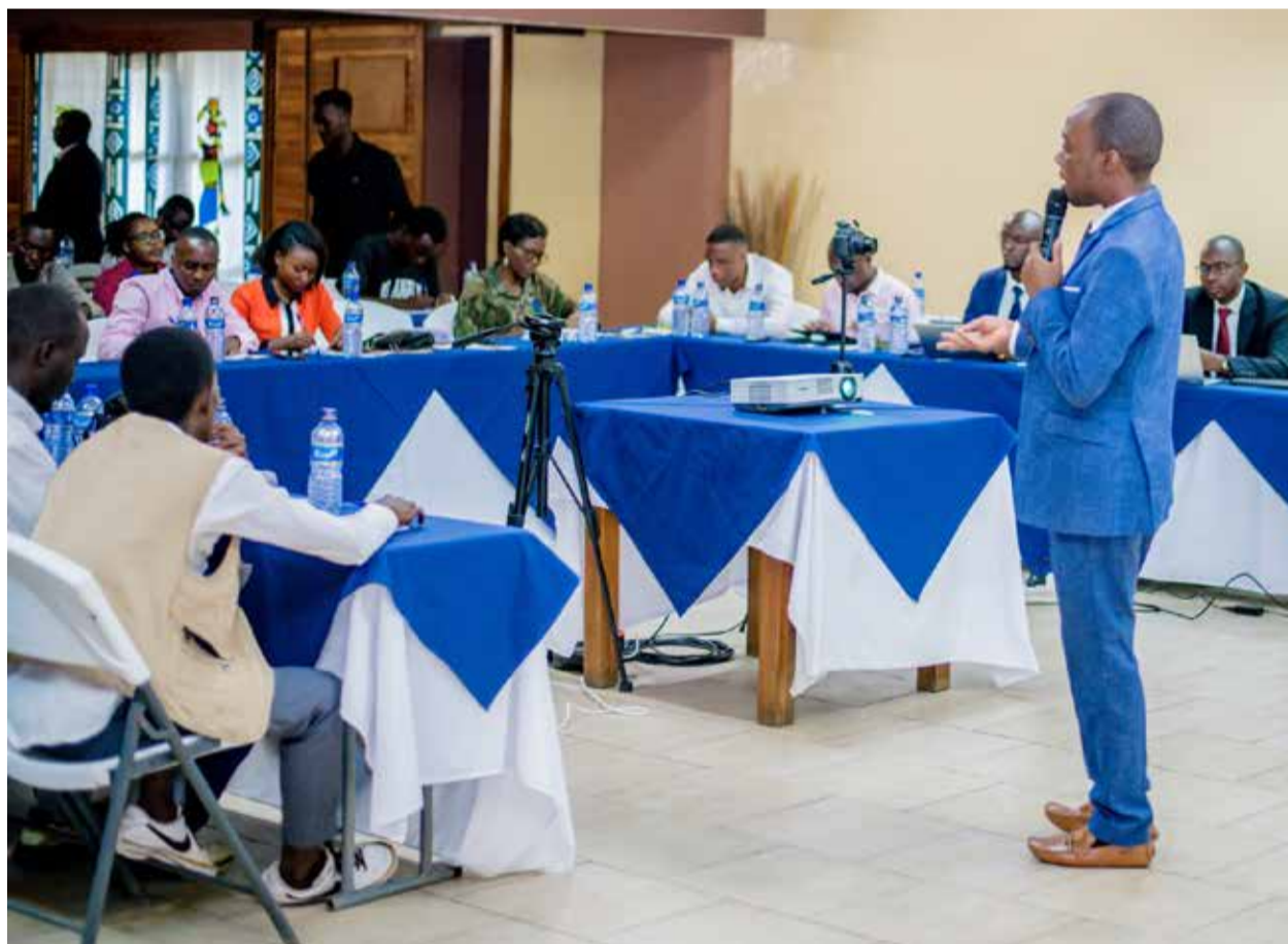
La date limite pour l'adhésion de tous les acteurs est fixée au 5 septembre 2026.

Il a également précisé que toutes les banques, les institutions de microfinance et les opérateurs de transfert d'argent par téléphone agréés par la Banque centrale doivent obligatoirement intégrer ce système, conformément à la réglementation publiée par celle-