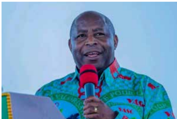
Fête du travail et des travailleurs

Entre reconnaissance des acquis et inquiétudes sur le pouvoir d'achat (page 2)