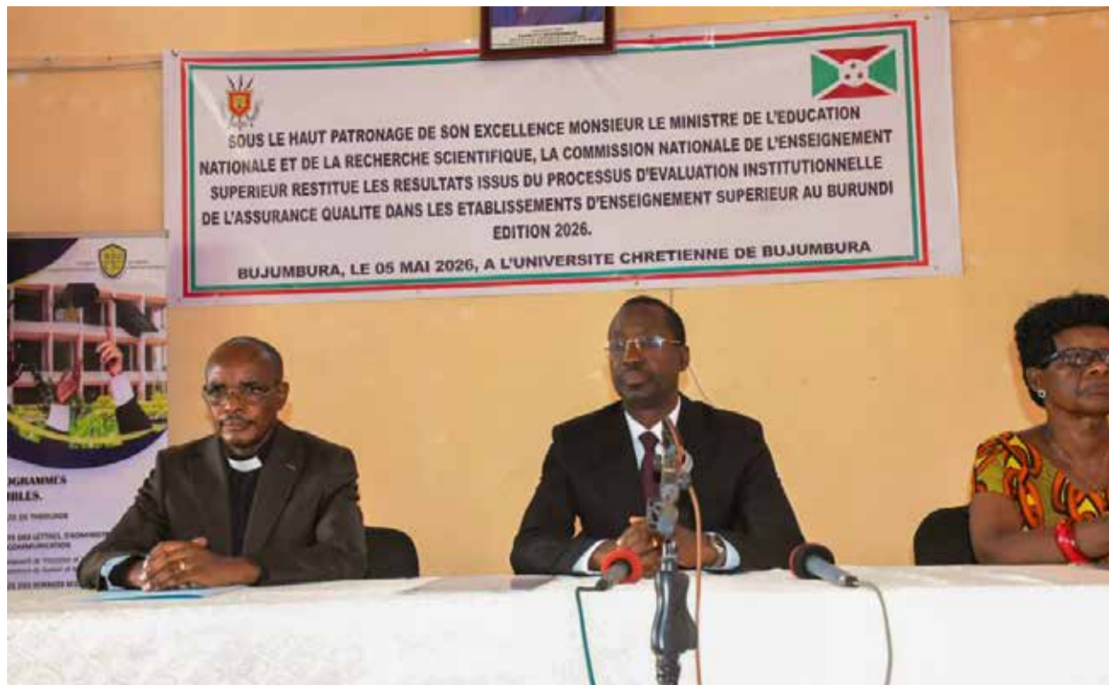
François Havyarimana, ministre en charge de l'éducation : « les institutions universitaires qui ont eu moins de 50% n'ont pas le droit d'accueillir les nouveaux lauréats »

Les institutions universitaires qui ont eu moins de 50% dans une étude menée par la Commission Nationale de l'Enseignement Supérieur (CNES) sur l'enseignement de qualité n'ont pas le droit d'accueillir les nouveaux lauréats. L'objectif de cette étude est de booster le niveau de la qualité de l'enseignement