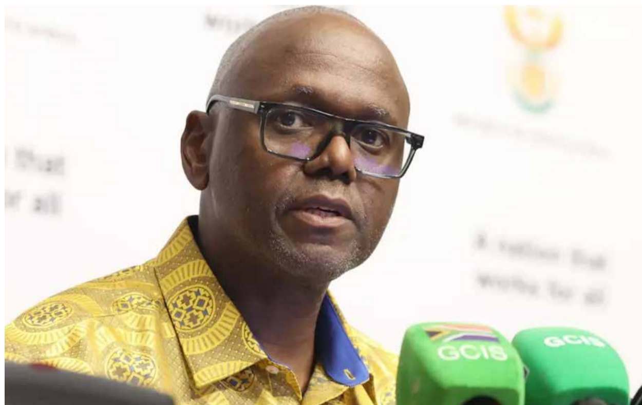
« Plutôt que de se limiter à des condamnations extérieures, il invite les Etats africains à s'attaquer aux causes profondes de la migration de masse ».

Face à la gravité de la situation, l'ambassade du Burundi en Afrique du Sud a publié un communiqué le 26 avril 2026. Elle y exhorte tous les