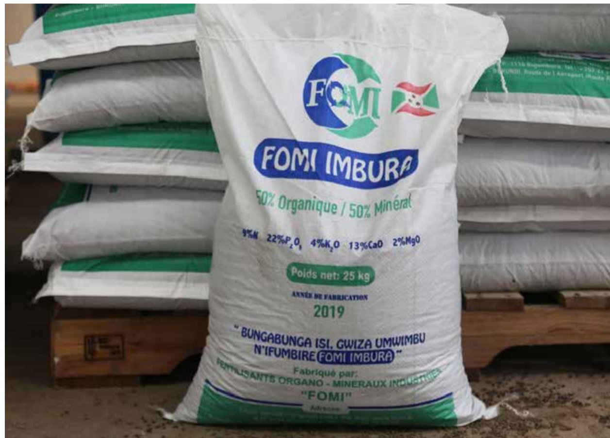
Dans l'ensemble, 62,3 pour cent des agriculteurs ont appliqué de l'engrais sur leurs cultures.

Malgré ces défis, il indique que le gouvernement est en train de faire tout son possible pour satisfaire