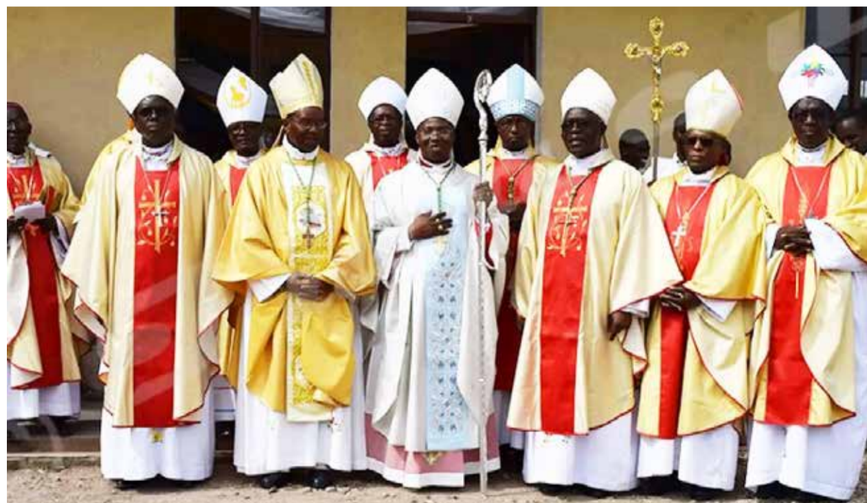
Les responsables de l'Eglise catholique du Burundi sont préoccupés par les défis socio-économiques, sécuritaires, etc. auxquels le pays fait face.

Les évêques regrettent que des enseignants, des médecins et d'autres professionnels choisissent de quitter le pays à la recherche de meilleures conditions de vie ailleurs. Ils estiment que les salaires actuellement perçus par ces catégories socioprofessionnelles restent largement inférieurs au coût réel de la vie. Ce qui pousse de nombreux travailleurs à chercher des opportunités en dehors du pays.