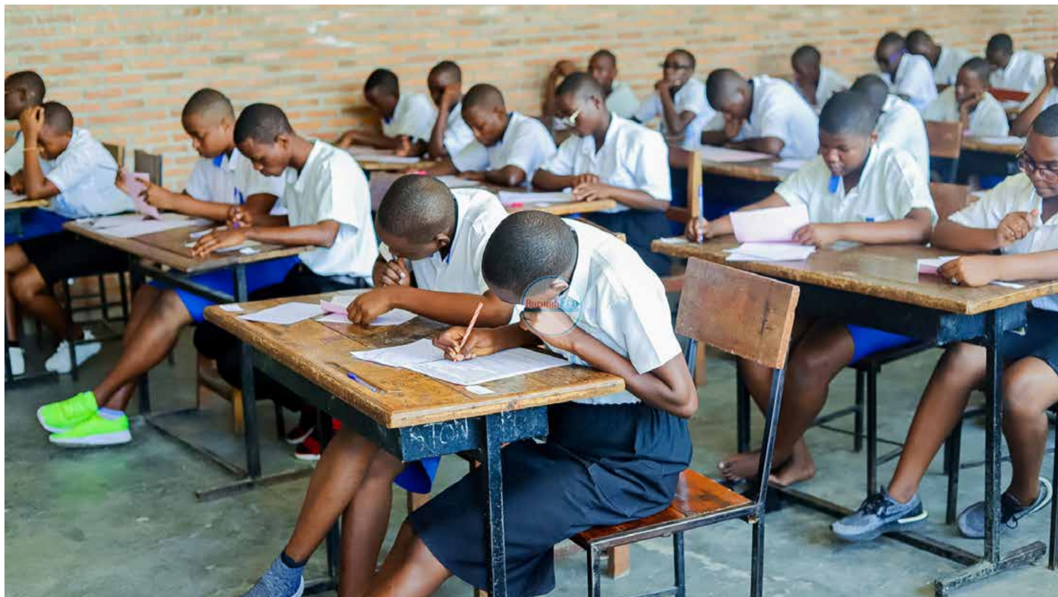
De nouvelles réformes sont prévues à partir de l'année prochaine dans le secteur de l'éducation.