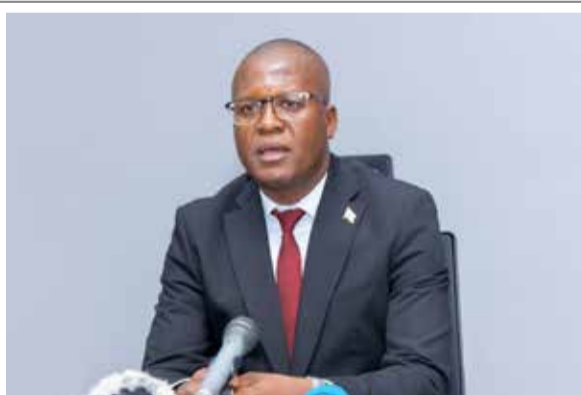
Pénurie du carburant

Les exploitants agricoles ne voient pas à quel saint se vouer (page 2)