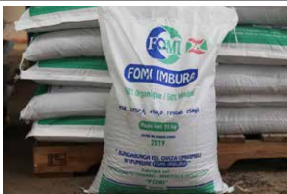
L'accès aux fertilisants organo-minéraux

Les exploitants agricoles ne voient pas à quel saint se vouer (page 2)