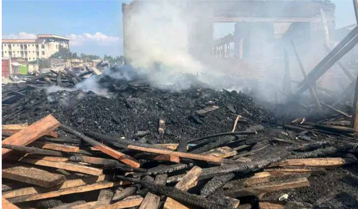
Depuis l'incendie du marché de bois de Jabe, les personnes qui y travaillent sont plongées dans le désarroi.

Le marché des planches de Jabe, situé dans la zone Bwiza de la commune Mukaza (Bujumbura), a une nouvelle fois été la proie des flammes. L'incendie s'est déclaré vers 1h du matin dans la nuit du 21 au 22 juin 2026 et les opérations d'extinction se sont poursuivies jusqu'aux environs de 8 h sans parvenir à maîtriser complètement le feu. Selon les premières constatations, plus de la moitié du marché a été détruite. Les pertes sont considérables. Une vingtaine de véhicules stationnés dans un garage ont été réduits en cendres. Des ateliers de menuiserie (où étaient assemblés des meubles en cours de fabrication) ont entièrement brûlé tout comme plusieurs autres ateliers équipés de machines de transformation du bois. Deux églises, une école et de nombreux commerces figurent également parmi les infrastructures sinistrées. Aucun décès n'a toutefois été signalé grâce à l'intervention