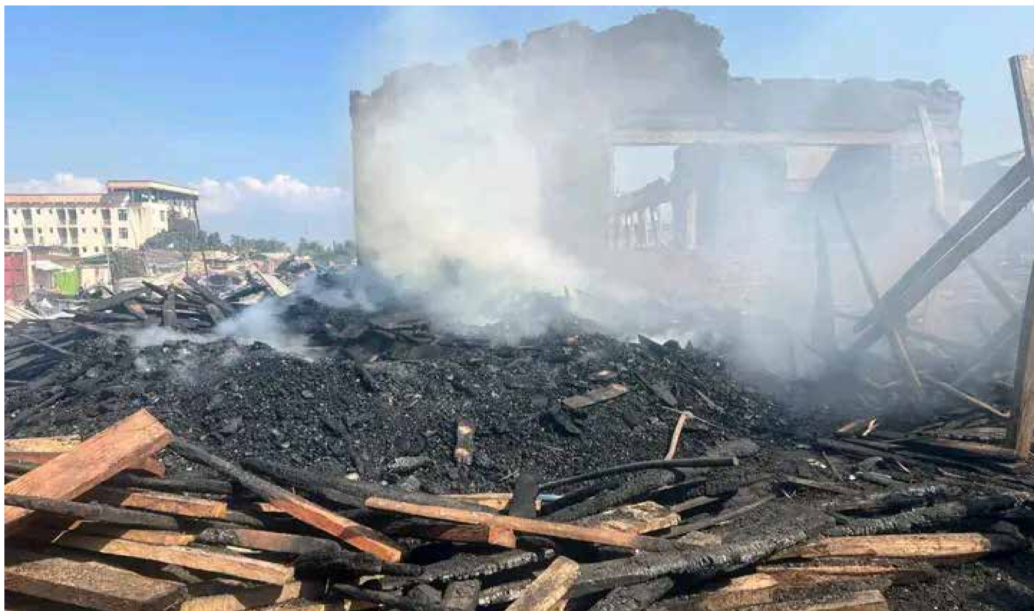
Au-delà de l'ampleur des dégâts matériels, l'incendie met en lumière la faible couverture des commerçants par les assurances.